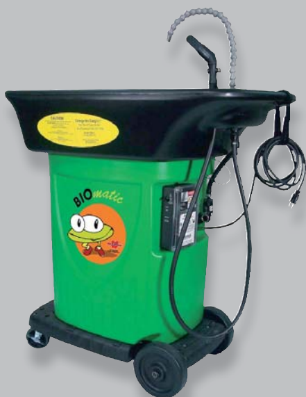
Fontaine Biomatic MOBILE prête à l'emploi

La fontaine Würth Biomatic et son fluide Biomatic : une technologie écologique naturelle de traitement des polluants.